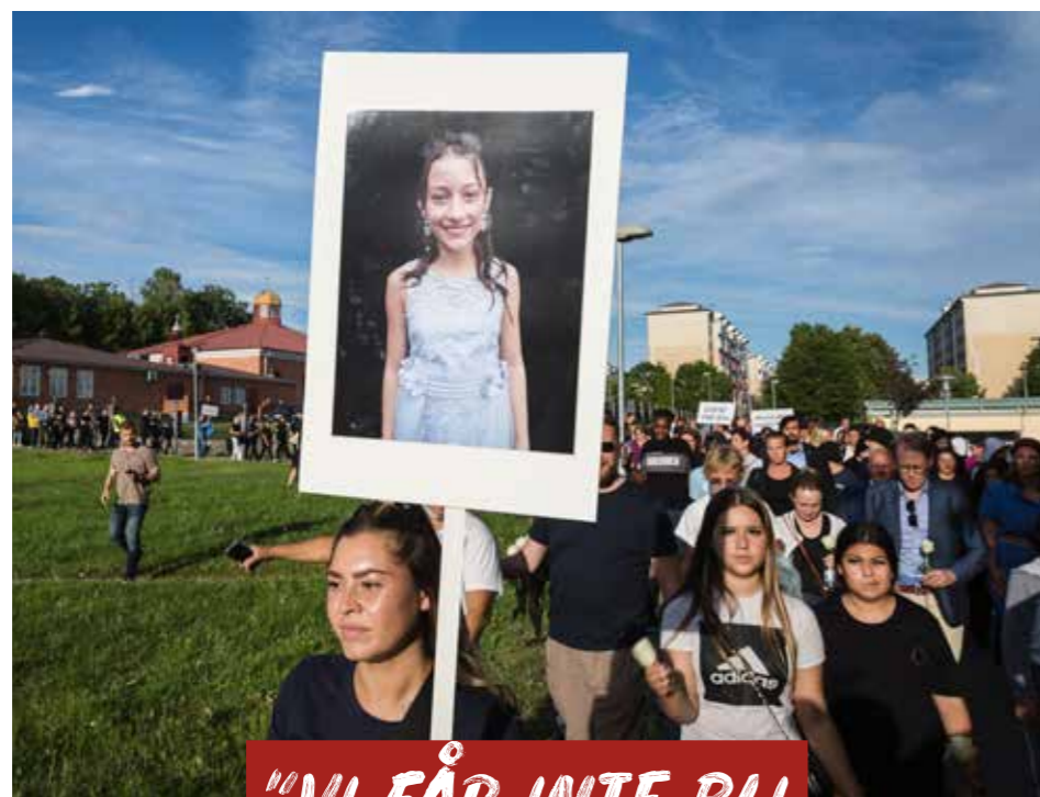
Efter Adrianas död startades Blomståget, en årlig manifestation till minne av Adriana och mot våldet.