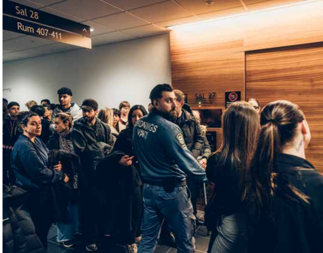
Vid rättegången i början av december fylldes Attunda tingsrätt av ungdomar som bar svarta t-shirts med budskap, bland annat "Länge leve Rio".

att han önskade att vuxenvärlden också vågade göra det – att se barns värde och ge alla möjlighet att växa upp till schyssta vuxna.