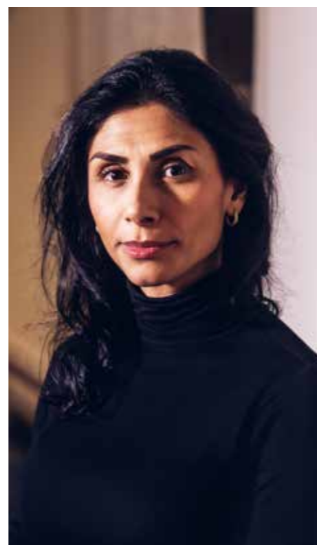
TEXT: ELIN LILJERO ERIKSSON

Roksana Schnittger, grundare av organisationen Ki-DS – Bättre digital barndom – om hur barn möter våld och kriminalitet digitalt.